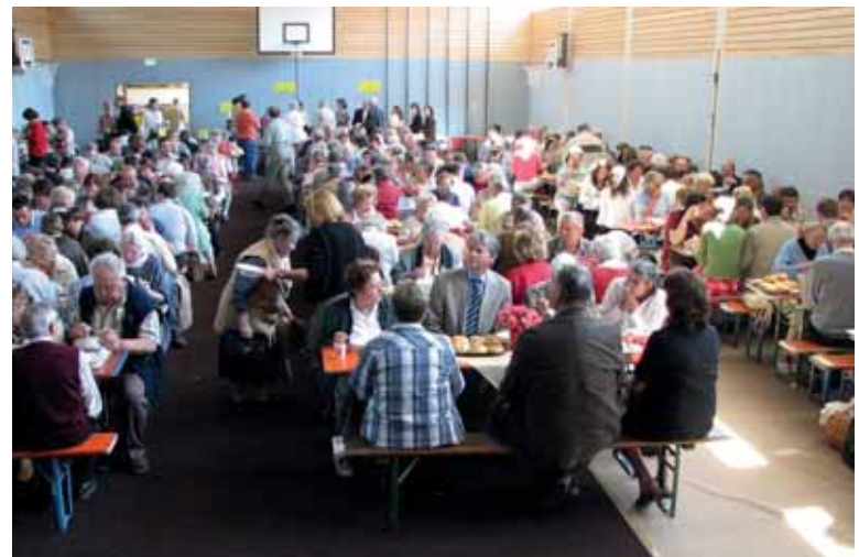
Mittagessen in der Turnhalle: Alle werden satt ...