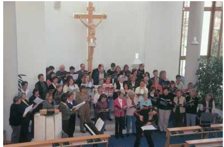
Tag der Chöre aus dem Chamer Dekanat

Eine große Freude war es für uns, dass der jährliche Tag der Chöre aus dem Chamer Dekanat diesmal bei uns stattfand. Anlass war das 10-jährige Jubiläum des Viechtacher Posaunenchores, den Schwester Gertrud damals