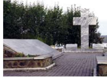
Gedenkstutte fur tausende Menschen, die bei dieser Zwangsarbeit ihr Leben verloren