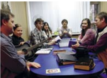
Im Mitarbeiterkreis in Ekaterinburg