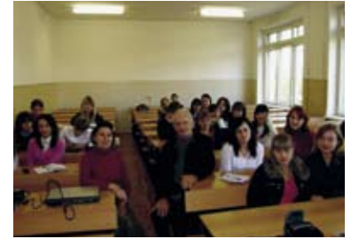
Bei Studentengruppen in der Uni