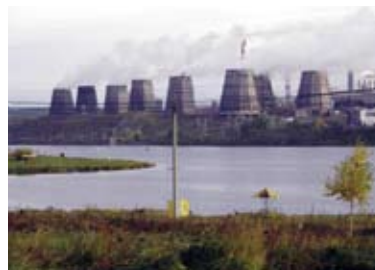
Aluminiumwerk, mit der gesamten Stadt erbaut von deutschen Straflager-gefangenen 1941-1945