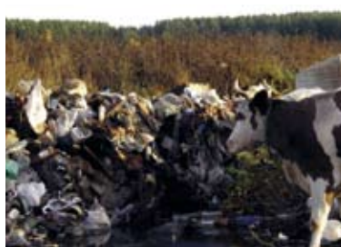
Kuhweide am Stadtrand von Krasnoturinsk