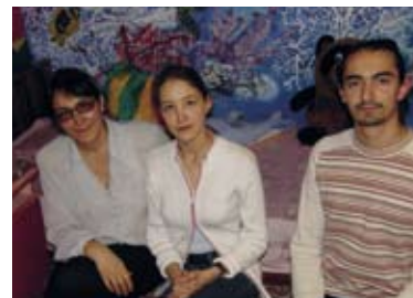
Herzliche Aufnahme in der Familie einer Arztin mit ihren beiden Kindern