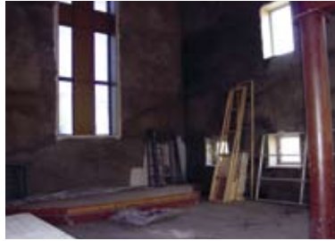
Kirche in Krasnoturinsk im Rohbau stagniert, weil die EKD kein Geld mehr herausrückt