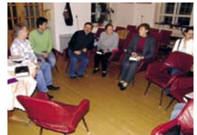
Bei den Bibelabenden in der Gemeinde in Ufa