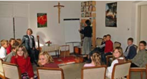
Erntedankgottesdienst mit Schulkindern aus Falkenstein