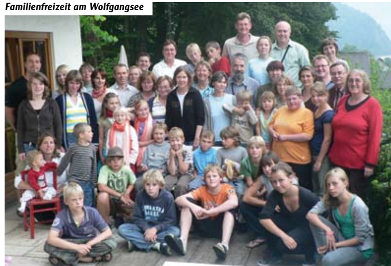
Familienfreizeit am Wolfgangsee