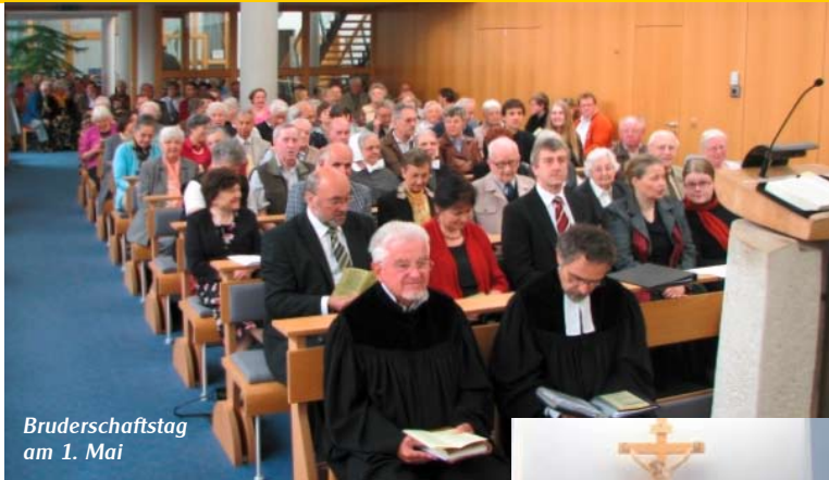
Bruderschaftstag am 1. Mai