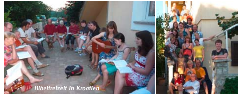
Bibelfreizeit in Kroatien