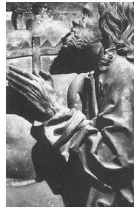
Veit Stoß Aus dem Vockamer Epitaph