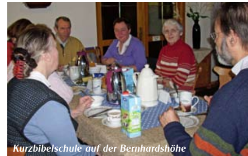
Kurzbibelschule auf der Bernhardshöhe