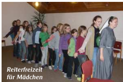
Reiterfreizeit für Mädchen