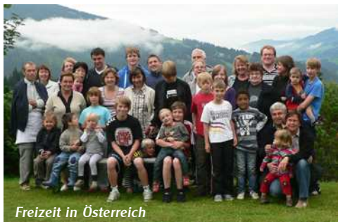
Freizeit in Österreich