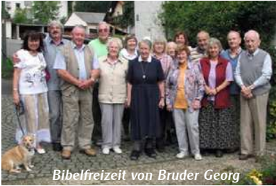
Bibelfreizeit von Bruder Georg