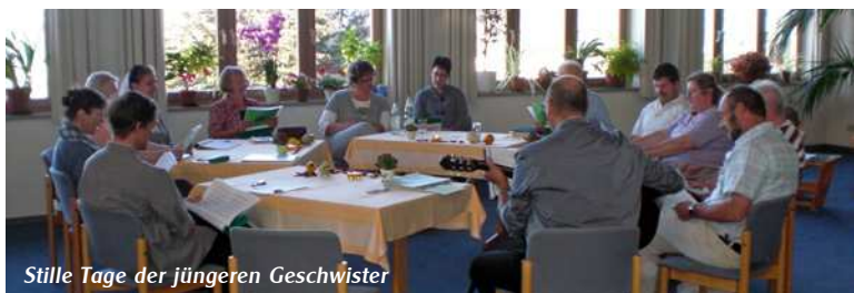
Stille Tage der jüngeren Geschwister