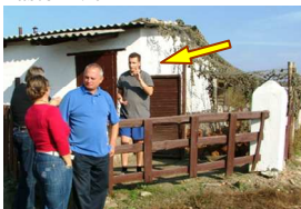
Leiter des Hauses