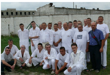
Taufe im Frühling