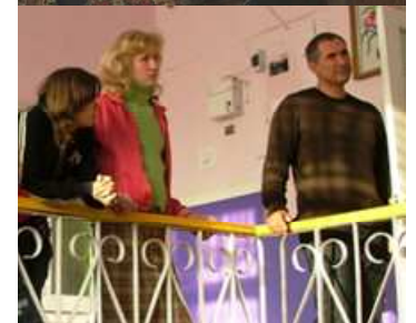
Leiter des Waisenhauses